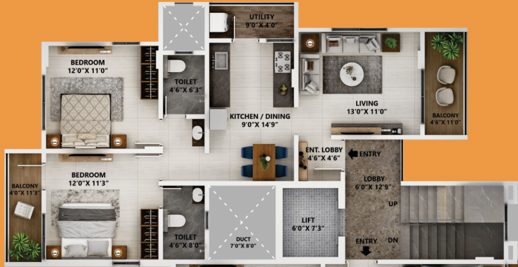
FIRST TO FOURTH FLOOR 2BHK FLATS - 815 & 831 SQ. FT. (RERA CARPET)