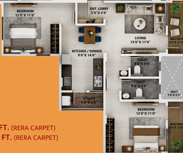
FIFTH FLOOR 1BHK FLAT - 715 SQ. FT. (RERA CARPET) 2BHK FLAT - 831 SQ. FT. (RERA CARPET)